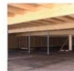
Aufstockung Möbel Platzl - Eppan