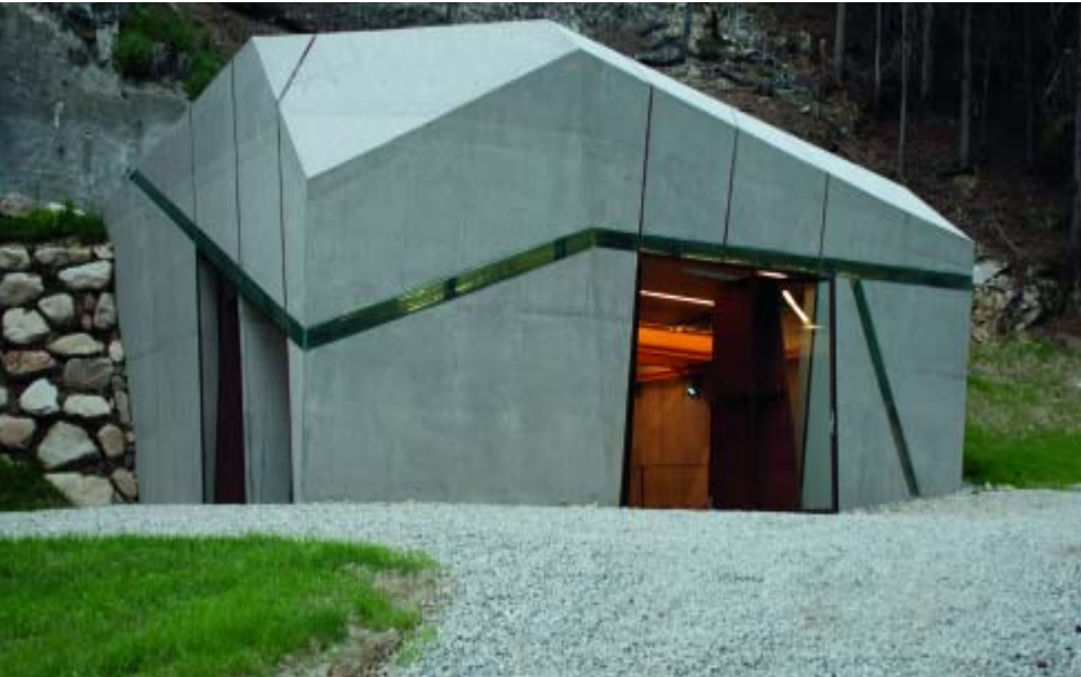
The hydroelectric power station on the Winnebach in Dörfel symbolises a block of stone which has broken off a cliff. Glass strips of light running around the structure underscore the fragile materiality of the stone.