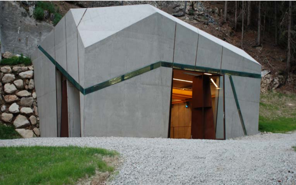
Das Wasserkraftwerk am Winnebach in Dörfel symbolisiert einen aus der Felswand herausgebrochenen Steinquader. Umlaufende Lichtbänder aus Glas unterstreichen die brüchige Materialität des Gesteins.